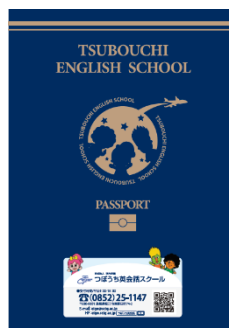
つぼうち英会話スクール