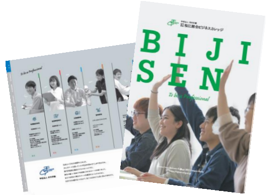
専門学校松江総合ビジネスカレッジ