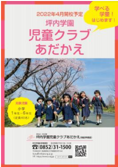
児童クラブあだかえ

各種パンフレットをご希望の方は、坪内学園本部 広報秘書課(TEL0852-31-1500)までお問い合わせ下さい。