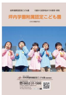
坪内学園附属認定こども園