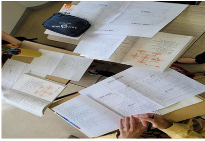
授業でのグループワークの様子